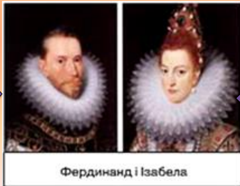
Фердинанд і Ізабела